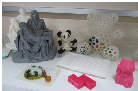
▲3D プリンタで製作した作品たち。精度の高さがうかがえる。