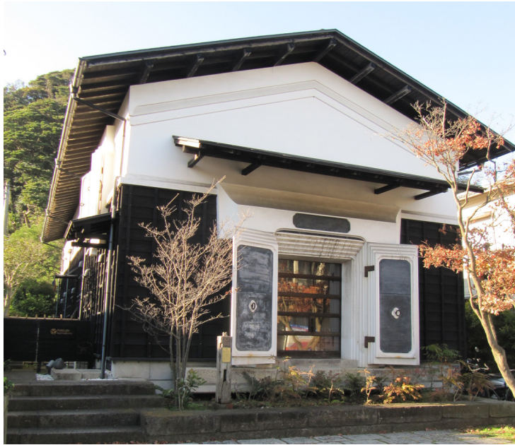
▲ファブラボ鎌倉外観

平成 29 年 12 月、ファブラボ鎌倉とおおたファブを視察訪問しました。その様子をお伝えします。