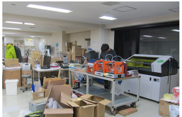
▲おおたファブ内観