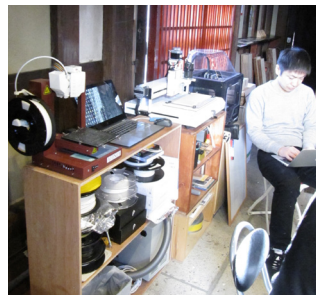
▲3D プリンタやミリングマシンが並ぶ