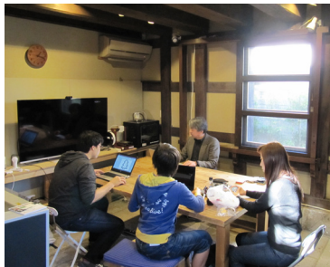
▲作業したり、お互いの作品を見せあう。