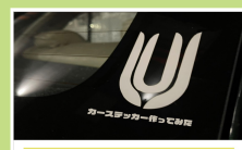
カーニュスタープロで線画

irolec Speedy100(レーザー加工機)を使ってオリジナルコースターを作ってみた