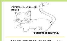
ベロレーレーザー機を使って 下書きを線画にする

[CLIP STUDIO PAINT] ベクターレイヤーを使った簡単なイラスト作成の仕方(下書きから線画へ)