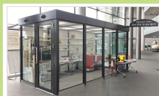
岩手県内のファブ施設を調査してみた